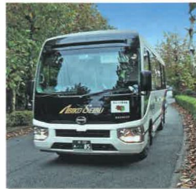
「住民の足」を目指すコミュニティバス

柏ビレジ自治会では2022年11月に平日約1ヵ月間の「実証実験」やその後の住民アンケート調査を実施。その結果などを踏まえて、「利用者負担」を原則に、乗り放題の「半年/年間パスポート」の導入など、できるだけ低予算で利便性の高いコミュニティバスの運行が実現できないか、さまざまな視点から検討してまいりました。その検討結果を次ページ以降に「案」としてまとめていますので、是非、ご検討の上、一人でも多くの皆様にご利用いただければと思います。