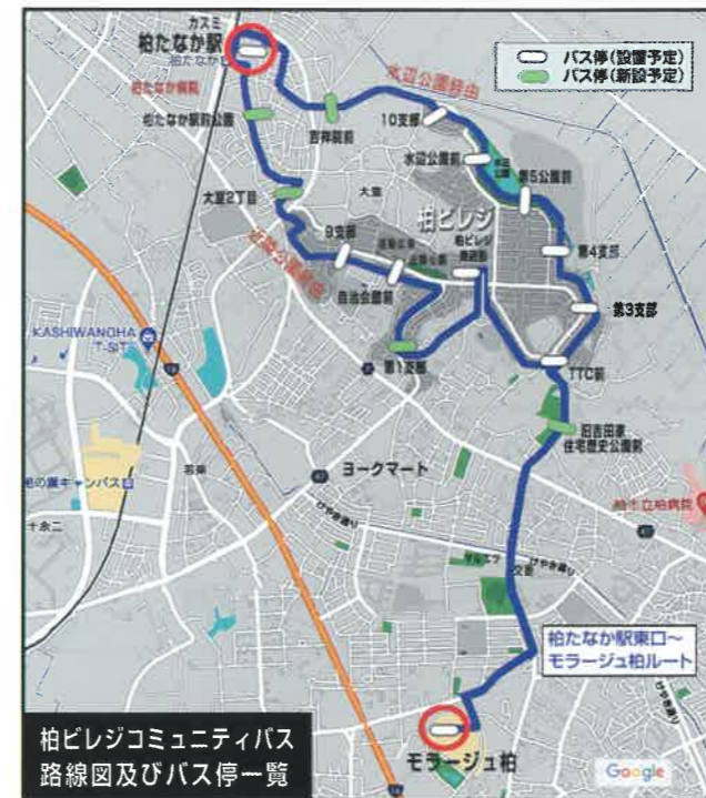
○はバスの出発地・到着地(予定)

柏たなか駅 (東口) ～柏ビレジ (水辺公園 経由 または 近隣公園経由) ～モラージュ柏