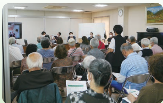
毎回盛況、関心の高さが伺えます

本年度6月から10月まで、柏北部地域包括支援センター（ほくほくセンター）の共催で、～人生最期まで住み慣れた柏ビレジの”我が家”で暮らしたい～を主テーマとして2022年前期として5回の講座を開催させて頂きました。毎回50名程度の参加、またたくさんのご質問を頂き、ビレジに住み続けたいという皆様の熱心な気持ちが伝わってきています。