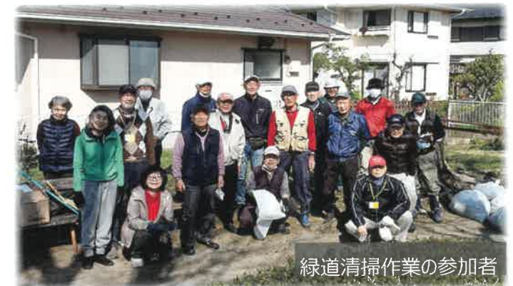
緑道清掃作業の参加者

2014年8月 ：東北大震災被災地の支援として三陸大槌の海産物加工品販売を開始。（2018年12月に終了）