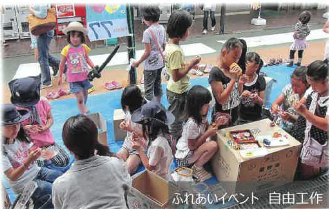
ふれあいイベント 自由工作

2013年6月 ：VS主催で「チビっ子大集合!! ふれあいイベント」を開催。以降、ビレジ内各団体の共同開催による「ワイワイフェスタ」、「ファミリークリスマス」へと発展している。