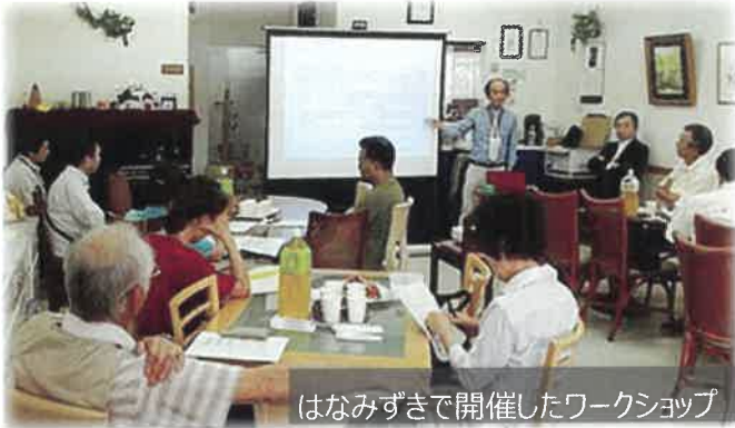
はなみずきで開催したワークショップ

2012年5月～8月 ：アンケート結果を踏まえ、ワークショップ「地域も自分も楽しくなるコミュニティビジネス～共に支え合う地域社会のあり方」を開催。高齢化が進む中、相互に助け合う仕組みとして有償ボランティアの事例を学び、柏ビレジでの展開を検討した。