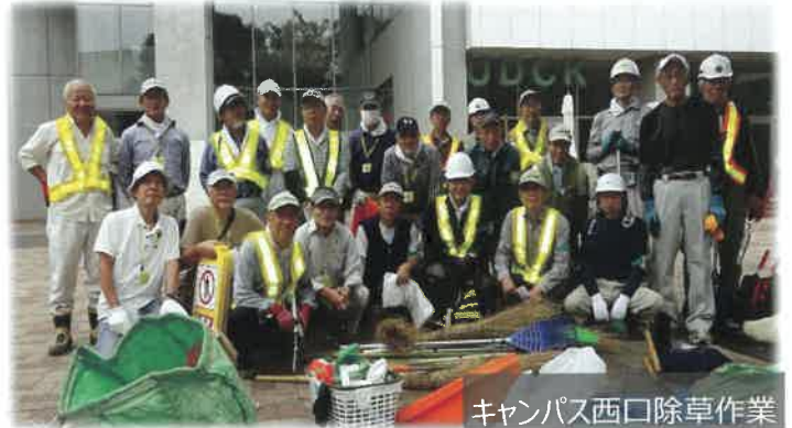
キャンパス西口除草作業

2013年12月 ：三井不動産(株)より柏の葉キャンパス地区の遊歩道管理業務を受託、その後の業務拡大でVSの財務基盤の確立に大きく貢献している。