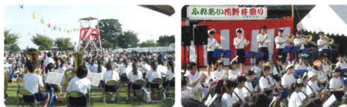
ふれあい花野井祭りの様子

年間行事活動につきましては、昨年同様、残念ながらコロナ禍により今年度の前半行事は、3密を回避することが難しいとの理由で中止と決定しましたが、本年6月のふ