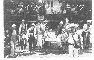
ワイワイフェスタ