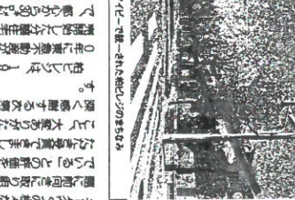
柏ビレッジ自治会(千葉県柏市)

「住まいのまちなみコンクール」は、全国的に展開している。これは、全国的に展開している。これは、全国的に展開している。これは、全国的に展開している。