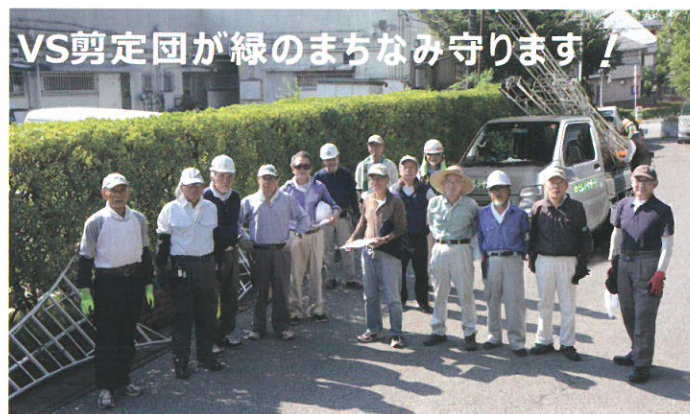
VS剪定団（愛称） 2018年8月 商店街の剪定作業

VSの剪定サービスは、庭木1本から承ります。ご都合やご予算にあわせて、まちなみを守るお手伝いをさせていただきます。どうぞお気軽にご相談ください。