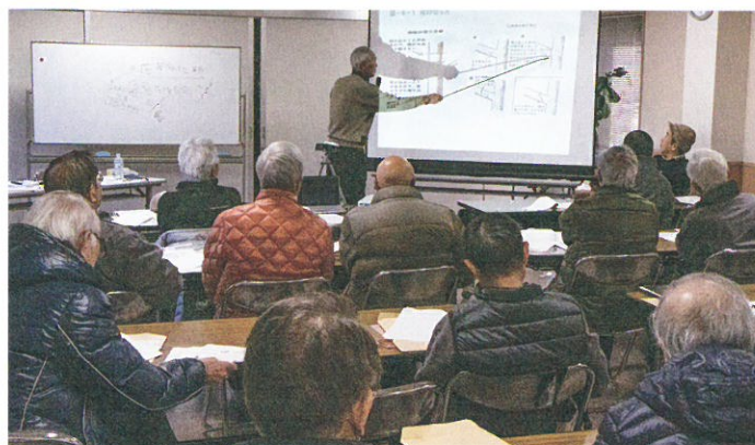
2019年2月 剪定ステップアップ講習 4回シリーズで実施

庭木が健やかに美しく育つように、樹木の生理を理解し、理にかなった剪定技術の習得と向上に努めています。2019年2月に専門家の指導でステップアップ講習を行いました。