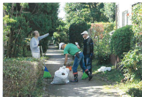
柏ビレジ授賞の記事 （一般財団法人 住宅生産振興財団 ホームページから転載）

開発者が計画した美しいまちなみを住民が育むとともに、年月を経たニュータウンの様々な課題に前向きに取り組んでいる。