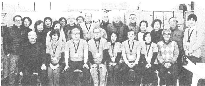
フレイルサポーター9名、参加者19名が大集合！」

心身の活力低下(フレイル)が気になる今日この頃、フレイルチェックへ。柏市から派遣のサポーターの指導で、滑舌、いす立ち上がり、握力、ふくらはぎ周囲長の測定や、栄養・口腔・運動・こころの状況もチェック。あちこちで、「えっ」「ああ」「うそー」等の声が上がると、最後は「フレイル予防」のお勉強。楽しい中にも気持ちも新たに、有意義な時間でした。