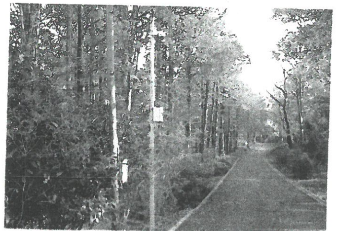
水辺の公園設置カメラ