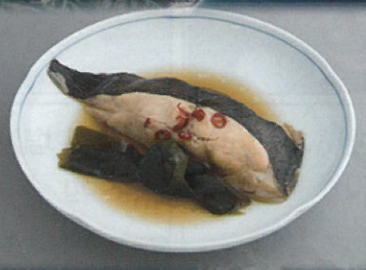
ベストセラーがより美味しくリニューアル マコガレイの煮付け