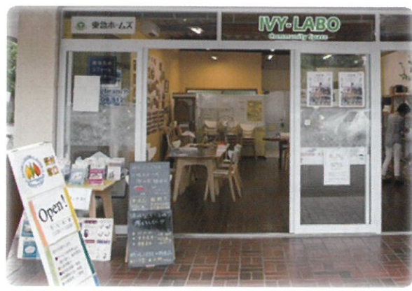
お魚屋さんには見えませんが、 美味しい商品を取り揃えています!

ビレジサポートはビレジ住民が運営するNPOです。 高齢化が進むビレジを元気で住みやすい街に・・・ 住民の皆様のお役に立ちたいと頑張っています。 復興中の東日本大震災支援とビレジ商店街の賑わいのために 三陸の美味しい海産物を加工業者さんから直送で仕入れ IVY-LABOの店頭で皆様に販売・お渡ししています。