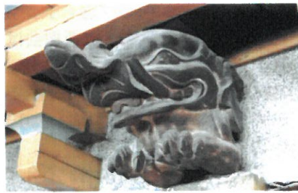
(ホテル内にある象の彫刻)

金谷ホテルでのお食事はお肉かお魚のチョイスとなりますが、歴代の料理長が引き継いできた“虹鱈のソテー金谷風”が特にお勧めです。(お魚が苦手な方は、子牛のカツレツとなる予定です。)