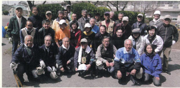
2015年3月 剪定講習会参加者

庭木剪定を中心に環境保全活動を展開、2015年度は、サービス実施件数が98件、協力員延人数は536人となる見込みです。利用者への満足度調査も実施、技術向上にも積極的に取り組み、より良いサービスの提供に向けて活動しています。最近では周辺地域からの依頼も増えています。