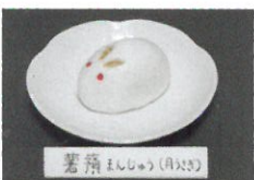
茗荷(みずき) (和菓子)