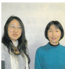
子供会会長 副会長さん