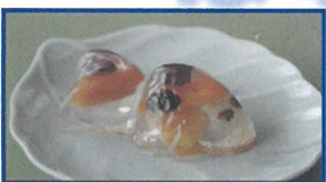
月・金曜日限定！ 手作り和菓子