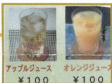
アップルジュース オレンジジュース ¥100 ¥100