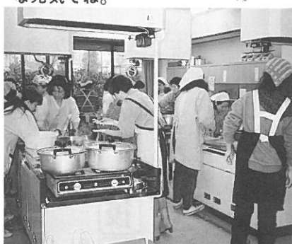
前日、とん汁を作る子供会等のお母さん。とん汁は大好評だったですよ。