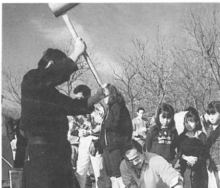
気合いのはいったもちつき。つきたてのおもちはやっぱり超おいしい。