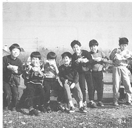
たくさん食べて将来は内閣総理大臣になろう。