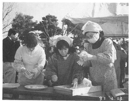
子供たちのために必死にきな粉、あんこ、おろしもちをつくるお母さん。使ったもち米なんと220kg。