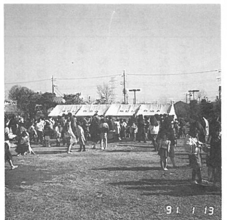
大にぎわいのもちつき大会。つきたてのおもちとん汁がとてもおいしいと子供達は大喜び。