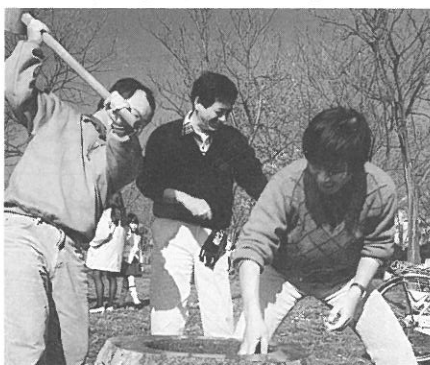
いよいよもちつき開始。真剣な表情の役員さん。