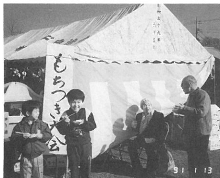
子供たちも、お年寄りも楽しそうに食べています。