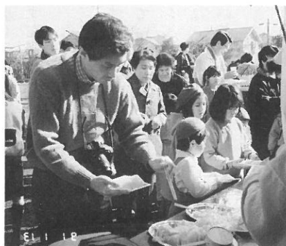
おもちをもらう子供たちと、おしんこをとるお父さん。今年1年、みんな元気だね。