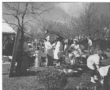
とん汁、おもち、お酒にミカンとおしんこ。裏方のお母さん達も大忙がし。