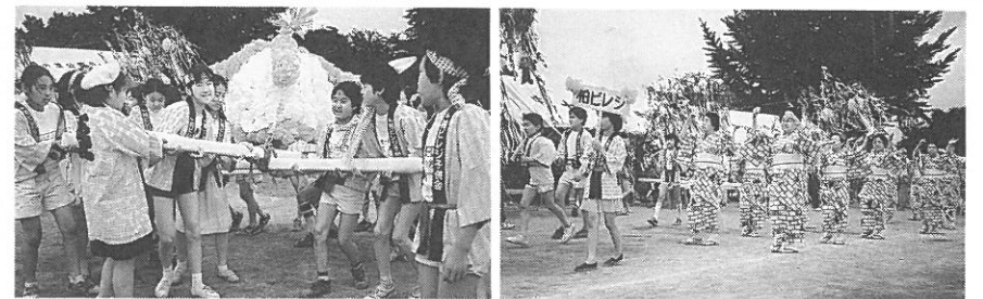
柏まつり田中地区大会の様子

つづく子供カラオケも昔の子供がヒョコヒョコ飛出し爆笑の中に終了。七夕コンクールは今年のテーマが「天の川」とか、柏ビレジの七夕様は大変よかったです。審査から洩れて残念ながら昨年と同じ参加賞。祭りもだんだん盛り上りを見せて来て「みどり」柏おどりがつづき、その後にはおはよしの音と共に子供達のワッショイワッショイが曇空に響き渡り、雲上のカミナリ様もビックリした事でしょう。