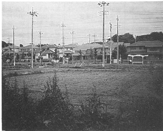
集合住宅建築予定地

自治会といたしまして、四月二十四日、柏市長、東急不動産各位に、集合住宅建設に對しての要望書を提出しております。