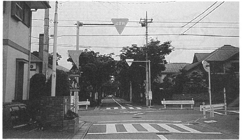
現地案内所前交差点に新設された「止まれ」の標識