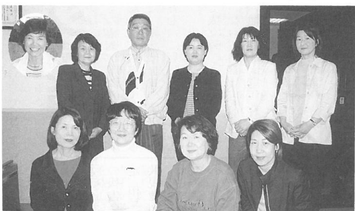
こんにちは、支部長です。

「災害は忘れたころにやってくる」「備えあれば憂い無し」と昔から言われております。市役所消防警察等の行政機関と連絡をとりながら、各種行事等の機会を通していざという時に備えていきたいと思っております。皆さんのご協力をお願いします。