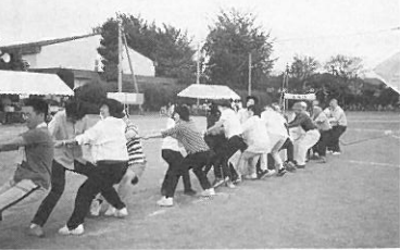
田中地区のおまつり、運動会は住民協の主催です。

流を目的としたものである、ということですが、私は、その活動を運営する為に、ビレジ自治会の代表の一人として、参加させて頂いたという訳です。十月に入り、「田中地区文化祭」があり、私が一番心に残る行事でした。とにかく、前準備が大変なものです。私が担当となつた「女性部」は、何日も前から細かい計画のもと準備を行い、当日は、朝五時からカレー、山菜おこわ、おはぎ、ケーキ、お餅等、手作りにこだわって力が入りました。又、野菜の即売会に関し