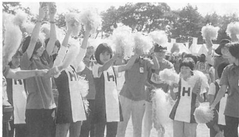
応援賞で準優勝獲得