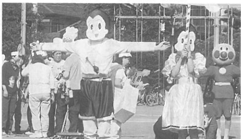
かかしコンテストで第3位