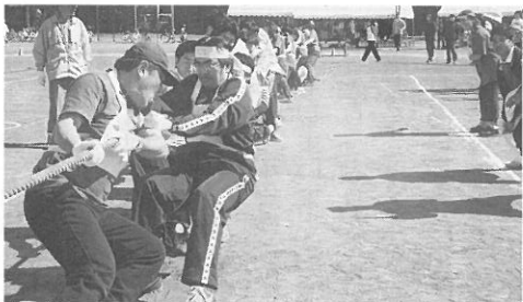
綱引きで1回戦突破