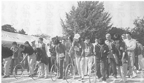
テクニックが必要なリーム転がし