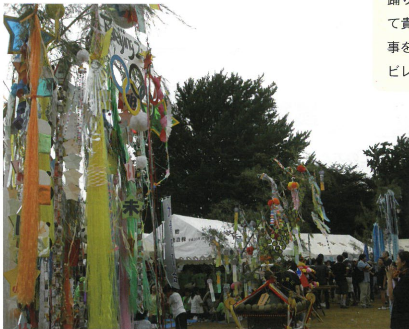
七夕飾りのテーマはエコでした！

柏まつり田中地区大会(七夕祭り)が7月6日午後1時より田中中学校で開催されました。当日はお天気にも恵まれ、田中地区各町会が、子供会による花神輿と七夕の笹飾り、踊りの会による柏踊りを披露しました。