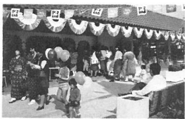
(柏ショッピングセンター開店記念)

るし、それに對し吾々は税金を支払っているの通の悪さ、遂に都おちしたとの感傷との交錯した複雑な心境でした。秋、冬も過ぎ、四月に入った頃、住民の皆さんに推されて、第六支部長に相成った折は、未だいたる処、空地だらけの戸数も僅か二十九戸程度の未開地の風情、でも徐々に入居も増え、再選二年目に入った頃から入居のテンポも加速、この頃には転居当時の複雑な心境も消えつ、新しい故郷意識に変化してきた己に気付きました。先輩役員諸氏の御指導のもと、自治会行事を消化しつ、時は流れ、任期満了を迎え、ホッとする暇もなく、会長の要請により地域の運営委員として引続き、ボランティア活動に入った次第、数多い行事に追われる日々明け暮れ早や、二年目後半を進行中、この地域活動の行事を通して、色々な人達とふれあい、土地の歴史、人情にふれまた環境にも慣れた故か、以前からこの地に