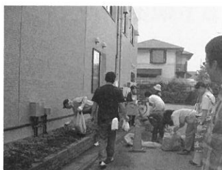
5月31日(日) クリーンデー ご協力ありがとうございました！ ←自治会館ウラも梅雨前にすっきり！