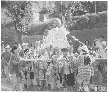
[夏だ祭りだ、ワッショイ・ワッショイ]