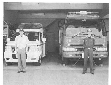
消防本部の消防車とパトロール車。

します。血液は大きく分けると、赤血球、白血球、血小板に分類され、赤血球は酸素、栄養物を各組織及び脳細胞に搬送するトラックの仕事をしています。煙には有毒ガス(一酸化炭素ガス)が含まれ、煙と空気を一緒に吸い込むと一酸化炭素ガスは酸素の250倍から300倍の速さでトラックに乗ってしまい酸素が乗