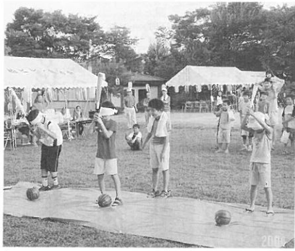
[ヨーシ! 当てるぞ、スイカ割り]