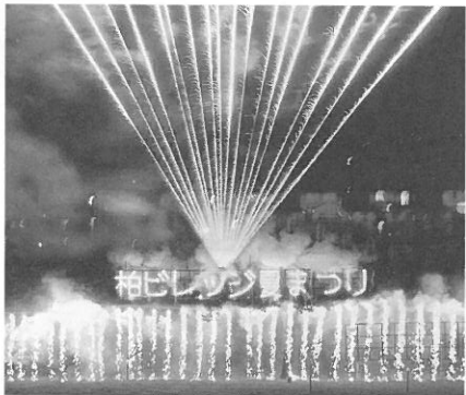
[花火が上がった、仕掛けもきれいだ]