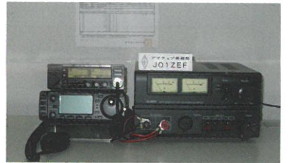
自治会館内の無線機

太陽の活動、電離層の伝播状況も上り調子、2013年頃にはピークになる予想で、クラブ員各局、長距離短波通信を楽しんでいます。