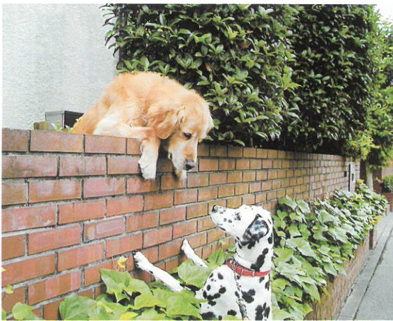
最優秀賞 (おともだち) 尾崎光代 (107-5)