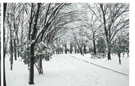
銅賞 (季節) 大野和男 (125-2) ※3枚組