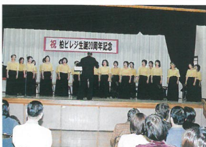
柏プリムラ・エ・コール