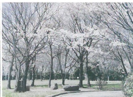
銀賞 (桜の柏ビレジ) 計良保雄 (85-2) ※3枚組