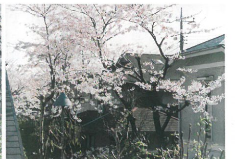
銀賞 (桜の柏ビレジ) 計良保雄 (85-2) ※3枚組