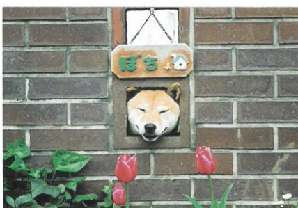
銅賞 (ぼくのおうち) 横村明子 (150-2)