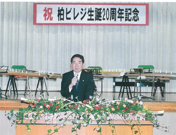
お祝いに駆けつけた本多晃柏市長

又、ビレジの今昔の航空写真が展示され、多くの来場者が二十年あまりが経過した二点の写真の違いに目を凝らしていた。中には我が家を見つけて感嘆の声を上げる来場者もあり、企画した実行委員も安堵の表情をみせていた。