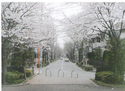
銀賞 (桜の柏ビレジ) 計良保雄 (85-2) ※3枚組