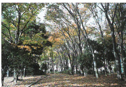
銅賞 (季節) 大野和男 (125-2) ※3枚組