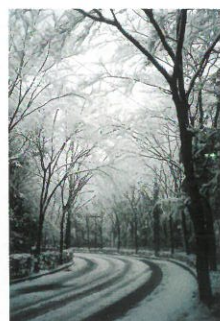
銅賞 (銀世界の朝) 野口みか (42-2)