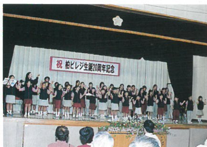
柏少年少女合唱団