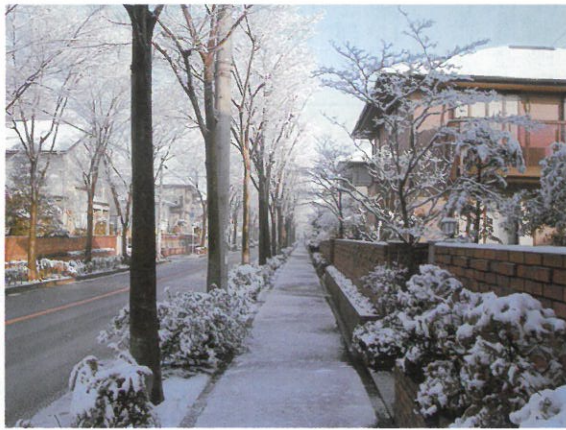
金賞 (雪の朝) 福田利治 (119-4)