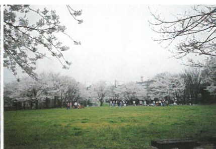
銅賞 (季節) 大野和男 (125-2) ※3枚組