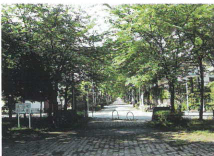
銀賞 (新緑) 槽谷四朗 (49-1)